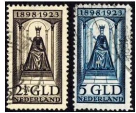
Uit kavel 3