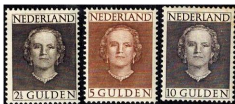
Uit kavel 36