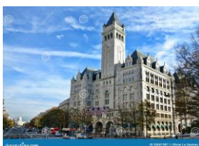
Voormalig hoofdpstkantoor Rotterdam

Ook in andere landen verrezen prachtige postkantoren Een voorbeeld daarvan zag ik later in Washington DC op een reis door de U.S.A. Ik heb daar het oude postkantoor van die stad bezocht en ook dat gebouw maakte indruk. Gelukkig is ook dat gebouw behouden en heeft een herbestemming gekregen.