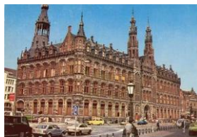
Voormalig hoofdpstkantoor Amsterdam

Ook in Amsterdam beleefde ik een soortgelijk iets. Bij een broer die in Amsterdam woonde en ik bij hem en zijn vrouw logeerde en dat postkantoor moest zijn. Dat prachtige gebouw naast al die andere mooie gebouwen, maakte toen ook indruk op mij.