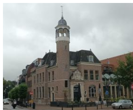
Oude postkantoor van Zeist.

Dit deed mij direct denken aan de glorie tijd van deze panden in mijn jeugd. Ik praat dan over de jaren '50 en '60 van de vorige eeuw. Toen al had ik bewondering voor het gebouw 'het postkantoor'. In mijn geboorteplaats Zeist werd ik voor het eerst met zo'n iconisch gebouw geconfronteerd toen ik daar met één van mijn ouders moest zijn om postzegels te kopen of voor andere zaken waarvoor mijn ouders naar het postkantoor gingen. Als tiener vond ik dit al, net als het er tegenover gelegen gemeentehuis, een interessant gebouw daar op 'Het Rond'.